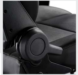
Lujoso asiento de ajuste continuo