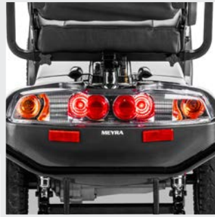
Motor de 700/3.000 W