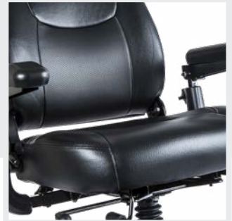
Sistema de asiento confort con muelles