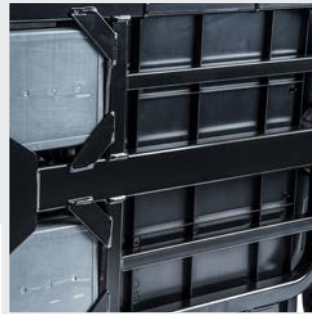
Bastidor de casete extremadamente robusto