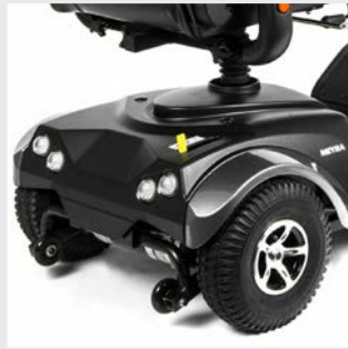
Potencia del motor de 1.600 W