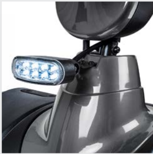
Última tecnología LED