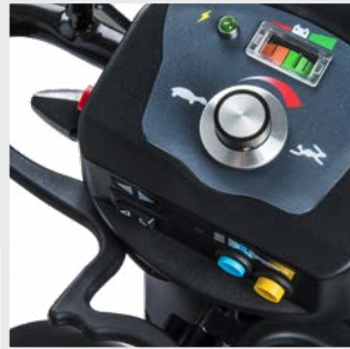
Simple guía para el usuario