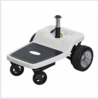
Radio de giro de 500 mm