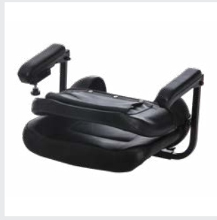
Se puede desmontar en tres partes