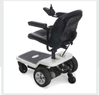
Tracción de rueda central