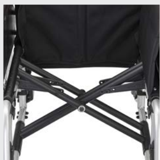
Tijera doble en serie