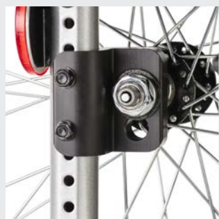
Prolongación de la distancia entre ruedas girando el varioblock hacia detrás