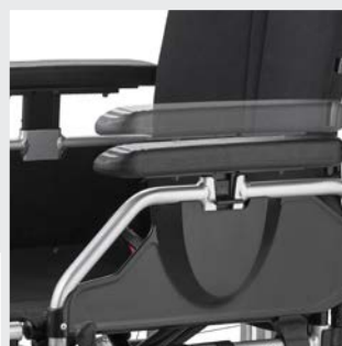
Lateral ajustable en altura con reposabrazos ajustable en profundidad